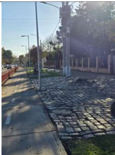
Zona 1 Av. Libertad