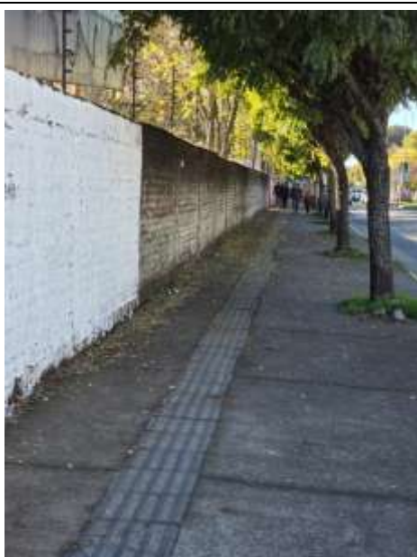
Zona 5 Av. O'Higgins