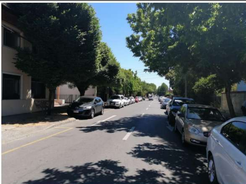
Zona 4 calle Rosas